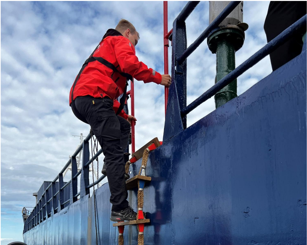
Losen border fartøyet som skal loses.