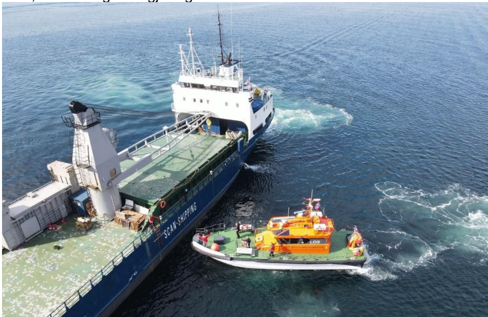
Bording og kvitting av los.

Vår målsetting på dette tidspunktet er å kunne sende ut konkurransegrunnlag på høring vår 2025, før endelig kunngjøring av anskaffelsen.