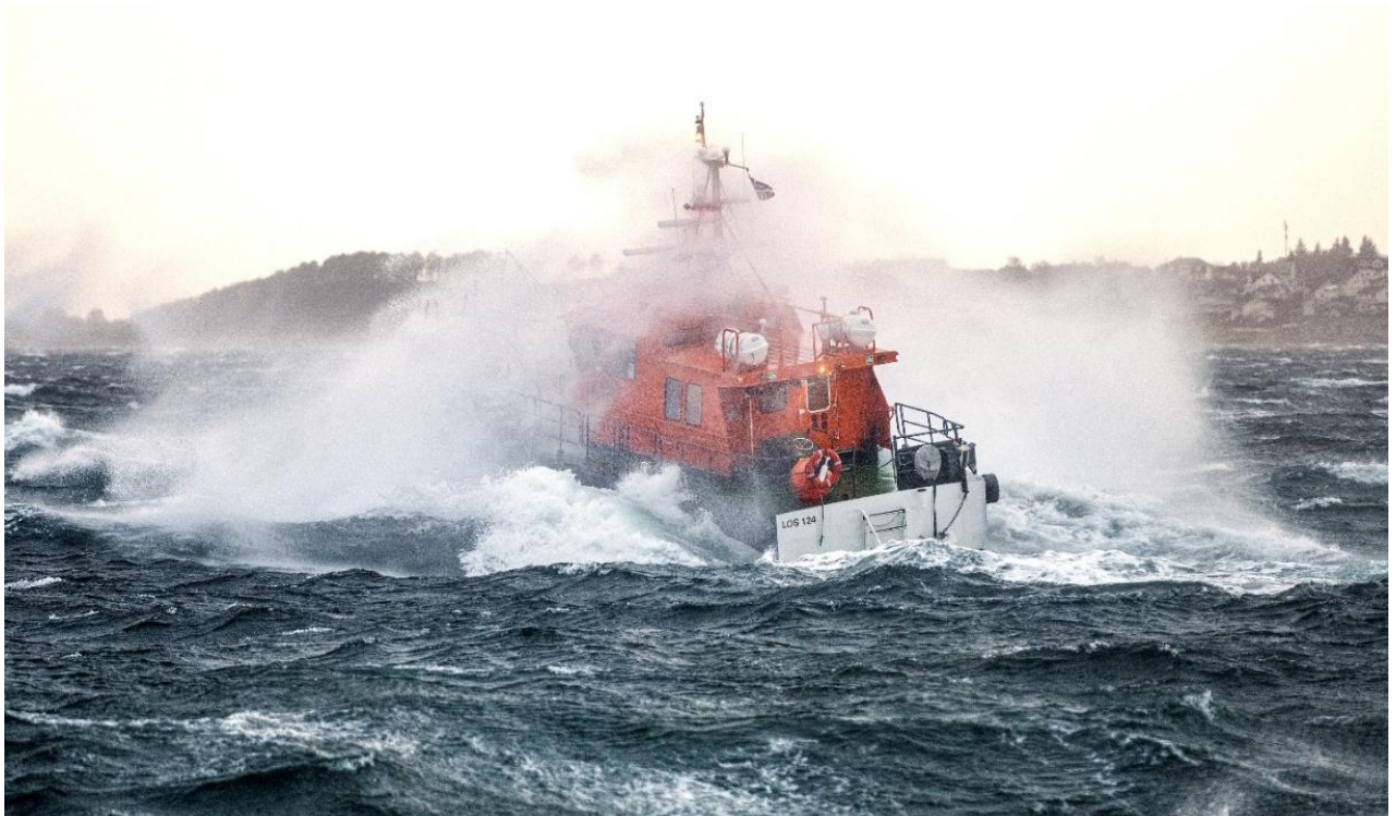
Losbåt i røft vær på Nord-Vestlandet.

Forskning og kompetanse: Forskning, utdanning og opplæring som bidrar til utvikling av nye teknologier, effektiv drift og bærekraftig praksis i bransjen.