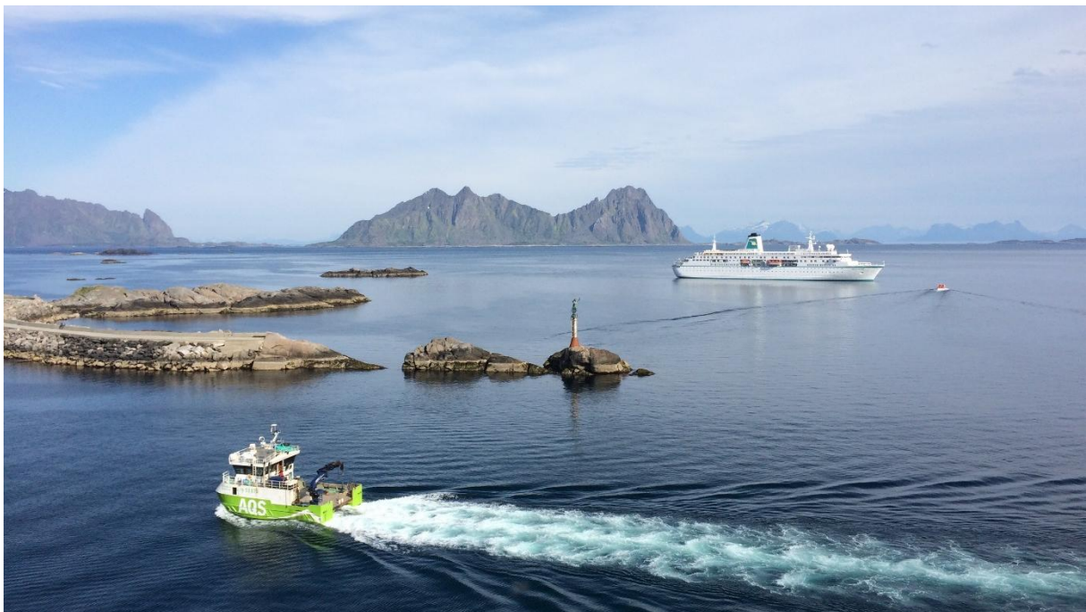
Kystverket tar ansvar for sjøveien langs norskekysten.

Les mer om Miljøvennlig tilbringertjeneste til sjøs