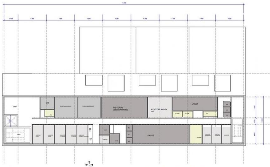
Figur 2: standardisert konseptskisse for nye strålesenter i Helse Sør-Øst, plan 2

Illustrasjonene viser en prinsipiell organisering av funksjoner, basert på føringer fra kunnskapsgrunnet, og viser et bygg over to etasjer med tre strålebehandlingsenheter. Det legges foreløpig til grunn at prosjektet avgrenses til å ivareta systemer internt i bygget, og at hovedsykehuset vil tilrettelegge for nødvendig infrastruktur fram til yttervegg. Prosjektet må derfor samhandle tett med hovedsykehuset og tilstøtende prosjekter der, og sørge for gode premissavklaringer knyttet til disse grensesnitt. Denne samhandling er en viktig forutsetning for prosjektet.