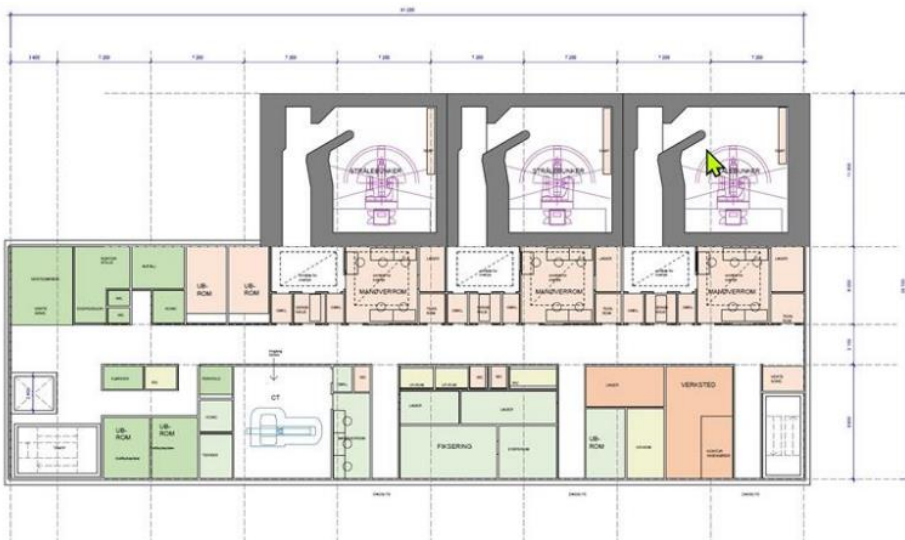
Figur 1: standardisert konseptskisse for nye strålesenter i Helse Sør-Øst, forberedt for samtidig bruk av tre linac, plan 1