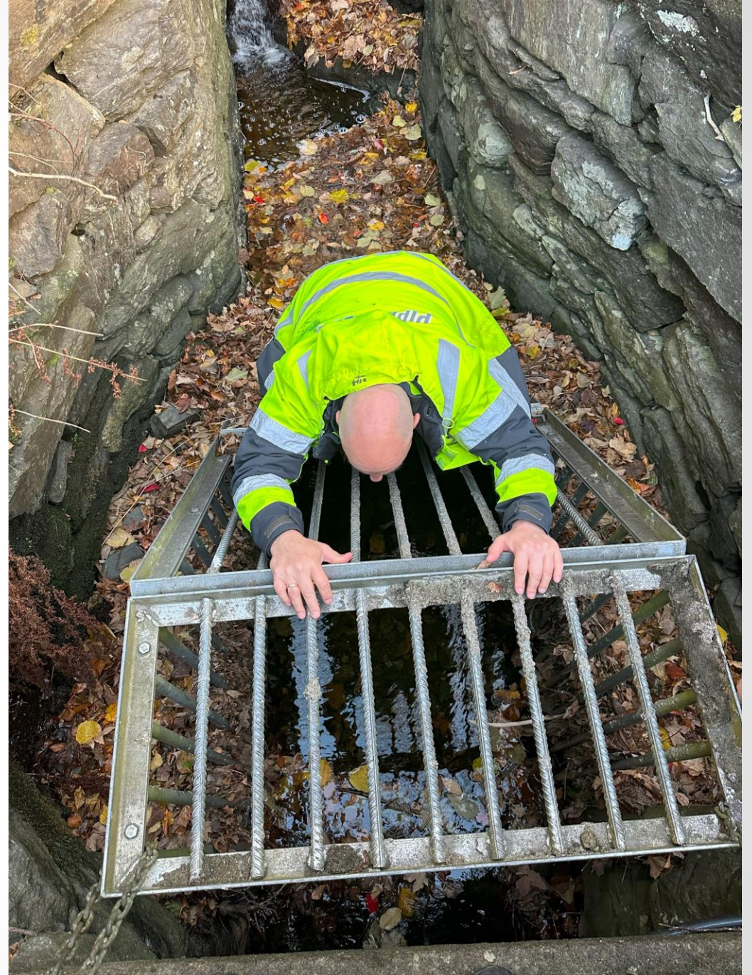
Inspeksjon av bekkeinntak i Bergen