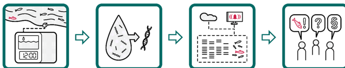
Figur 1. illustrerer de ulike trinnene i en automatisk miljøovervåking. Første bilde viser en kontinuerlig innsamling av prøver fra vann. Deretter filtreres vannprøvene og DNA tas ut. Til slutt analyseres prøvene og varsel sendes om noe uønsket oppdages. En slik innretning vil gi mulighet for å sette inn tiltak tidlig for å begrense og hindre skade.