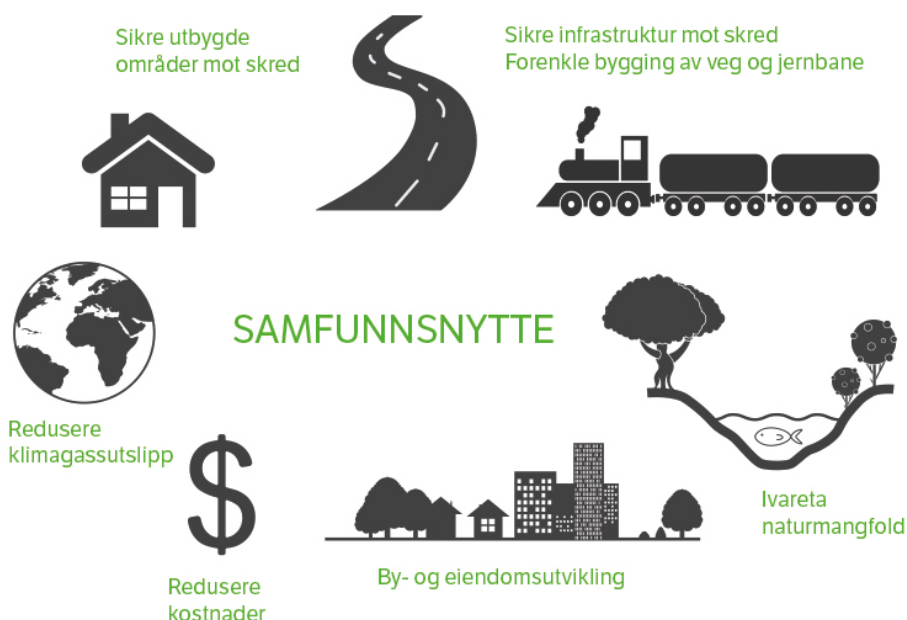
Figur 1 Illustrasjon av samfunnsnyten ved å utvikle nye klimavennlige sikrings- og grunnforsterkningsmetoder

Miljøvennlig by- og tettstedsutvikling forutsetter fortetting, transformasjon og mer effektiv arealbruk. Mange av de ubebygde arealene er ubebygd nettopp pga. naturlige årsaker som bl.a. dårlige grunnforhold eller flomfare. Likevel er mye av den fremtidige veksten foreslått i flomutsatte områder med dårlige grunnforhold (kvikkleire). I tett bebygde strøk er det vanskelig og kostbart å gjennomføre plasskrevende sikringstiltak. Kvikkleireforekomster kan medføre byggeforbud og således hindre fortetting og stoppe utbyggingsprosjekter. Ved å utvikle nye sikringsmetoder der omfattende terrenginngrep unngås, vil man kunne utvikle tomtearealer mer uavhengig av grunnforhold.