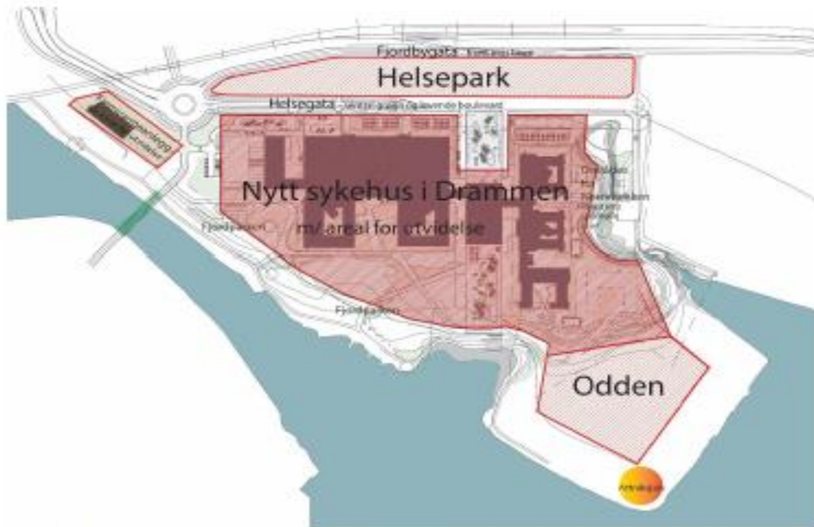
Figur 1-3: Illustrasjon som viser delfelt innenfor planområdet