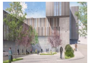
Nytt klinikkbygg & proton Radiumhospitalet