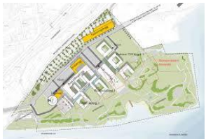
Nytt sykehus i Drammen