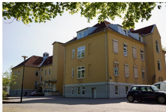
Dagens Blakstad sykehus