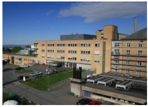
Nytt akuttsykehus Aker