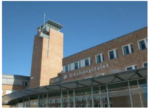
Utvidelse Gaustad (Region/lokal)