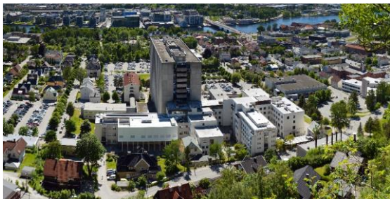
Dagens Drammen sykehus