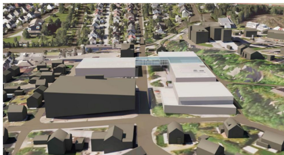
Figur 29 Volumskisse av anbefalt løsning – alternativ 2.1 Rehab og tilbygg Frydenlund (illustrasjon: Arkitektskop)