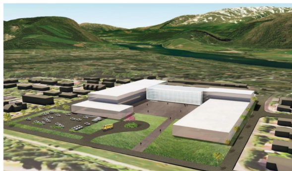
Figur 34 Alternativ anbefalt løsning – alternativ 2.2 samlokalisering Kippermoen (Illustrasjon: Arkitektskap)